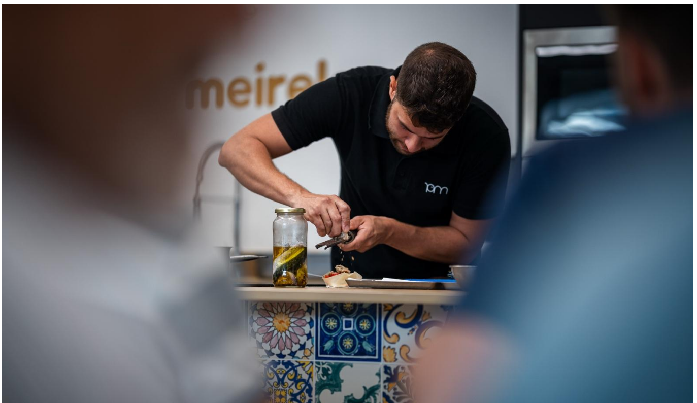
Figura 3. Showcooking

Ativações de Marca, enquanto atividades realizadas por entidades externas com pretensões comerciais, tais como, sessões fotográficas, ações promocionais de marcas, etc.; iii) Programas Especiais, dedicados à vertente de responsabilidade social com vista a promover a literacia na alimentação e na saúde, de onde surge o programa “Dias de Saúde no Bolhão” (De Manhã Começa o Dia, Projeto NABo e Bolhão + Saudável); e iv) Artes e Entretenimento, com diversas atividades culturais, artes e animação, idealmente ligados à sua natureza agroalimentar, tais como, exemplos: ciclo de música “Há Fado no Mercado”, tertúlias literárias, concertos musicais, artes performativas, exposições artísticas, outros.