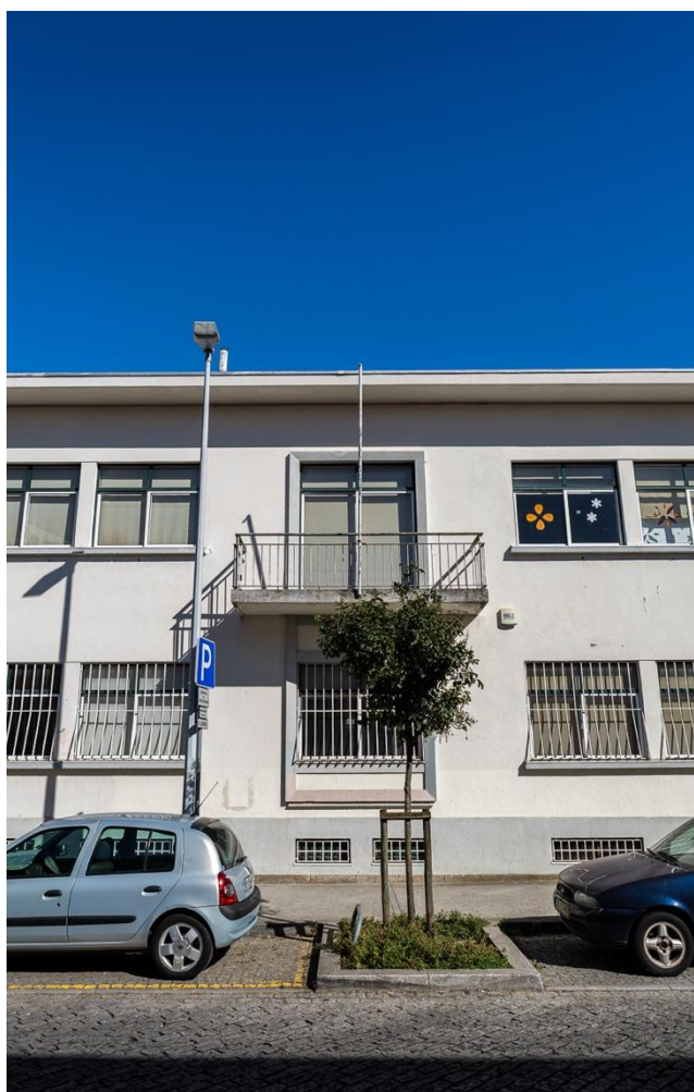
Figura 7. Centro de Saúde Porto Douro ©Luís Moura