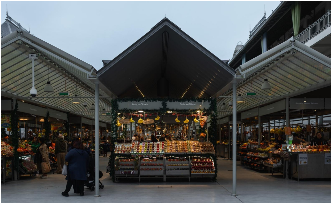
Figura 2. Mercado do Bolhão

Neste contexto, a gestão do mercado tem como princípio estruturante o diálogo permanente com os comerciantes (as “suas gentes”), assumindo a colaboração como condição essencial para o equilíbrio interno, para a clarificação de normas e para a manutenção de um ambiente de trabalho que valoriza a autenticidade e o tradicional como sua génese. Este diálogo sustenta a construção de um espaço coeso, organizado e adaptado aos desafios atuais, promovendo a equidade entre operadores e reforçando o papel do Mercado enquanto ecossistema económico e patrimonial vivo.