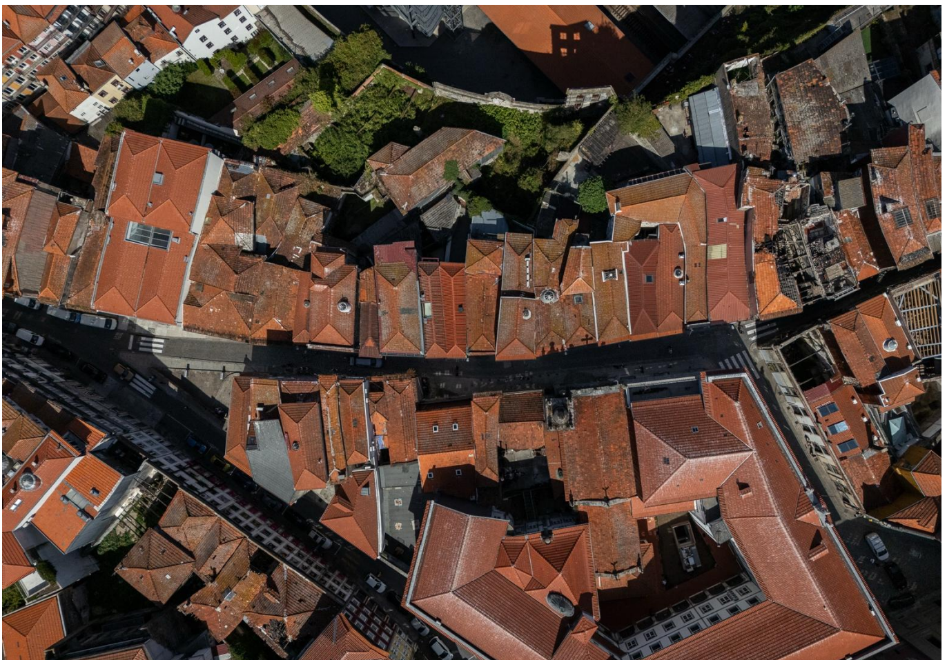
Figura 8. GEP - Rua de Cimo de Vila e Outras ©Luís Moura

Rua de Salazares e Rua da Preciosa, Rua do Seixal, Rua das Eirinhas (Fase 2), Rua General Sousa Dias, Rua Duque de Loulé e Rua Saraiva de Carvalho, Rua Sarmento Beires, Rua Sport Comércio e Salgueiros, Rua da Sociedade Protetora dos Animais, Rua de Vale Formoso, arruamentos diversos na Lapa, Travessa da Arrábida, arruamento de ligação da Rua Dr. Júlio de Matos à Rua Henrique Sousa Reis e Obras de Urbanização da UOPG1 – Unidades de Execução UE1, UE2 e UE3 – Avenida Nun'Álvares.