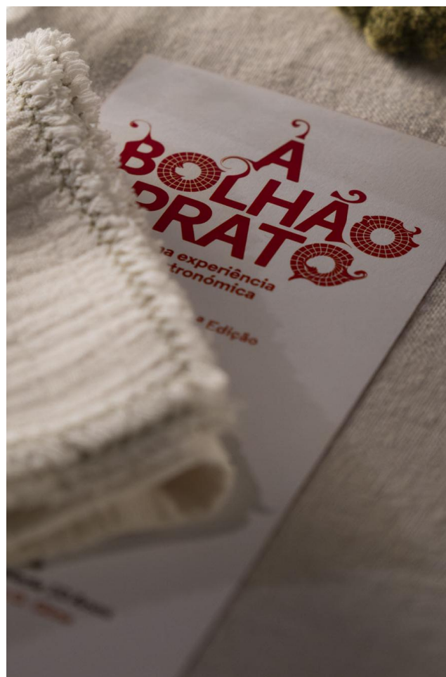
Figura 5. À Bolhão Prato

entre gastronomia, comunidade e tradição. Estes momentos, concebidos para promover o consumo consciente e a valorização dos produtos locais, aproximam os visitantes dos comerciantes e das suas histórias, criando experiências únicas que ligam o saber fazer à degustação. A aposta passa também pela criação de novos eventos e parcerias gastronómicas que estimulem o conhecimento dos produtos, incentivem o consumo no mercado e fortaleçam a ligação entre produtores, chefs e público.