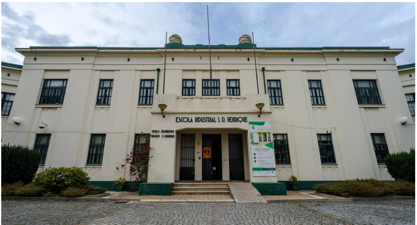
Figura 6. Escola Industrial Infante D. Henrique