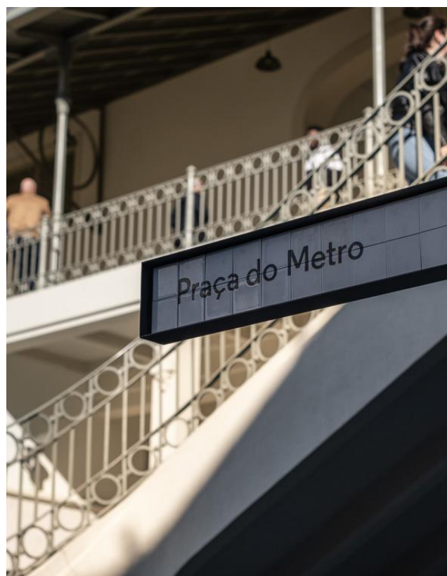
Figura 4. Mercado do Bolhão

O GCP pretende também desenvolver parcerias estratégicas com operadores de transporte público, nomeadamente STCP e Metro, para promover a mobilidade sustentável e o acesso facilitado ao Mercado. Estas sinergias poderão incluir descontos em bilhetes, campanhas cruzadas, passatempos conjuntos e ações de comunicação partilhadas, reforçando o posicionamento do Bolhão como um destino acessível, sustentável e integrado na malha urbana da cidade.